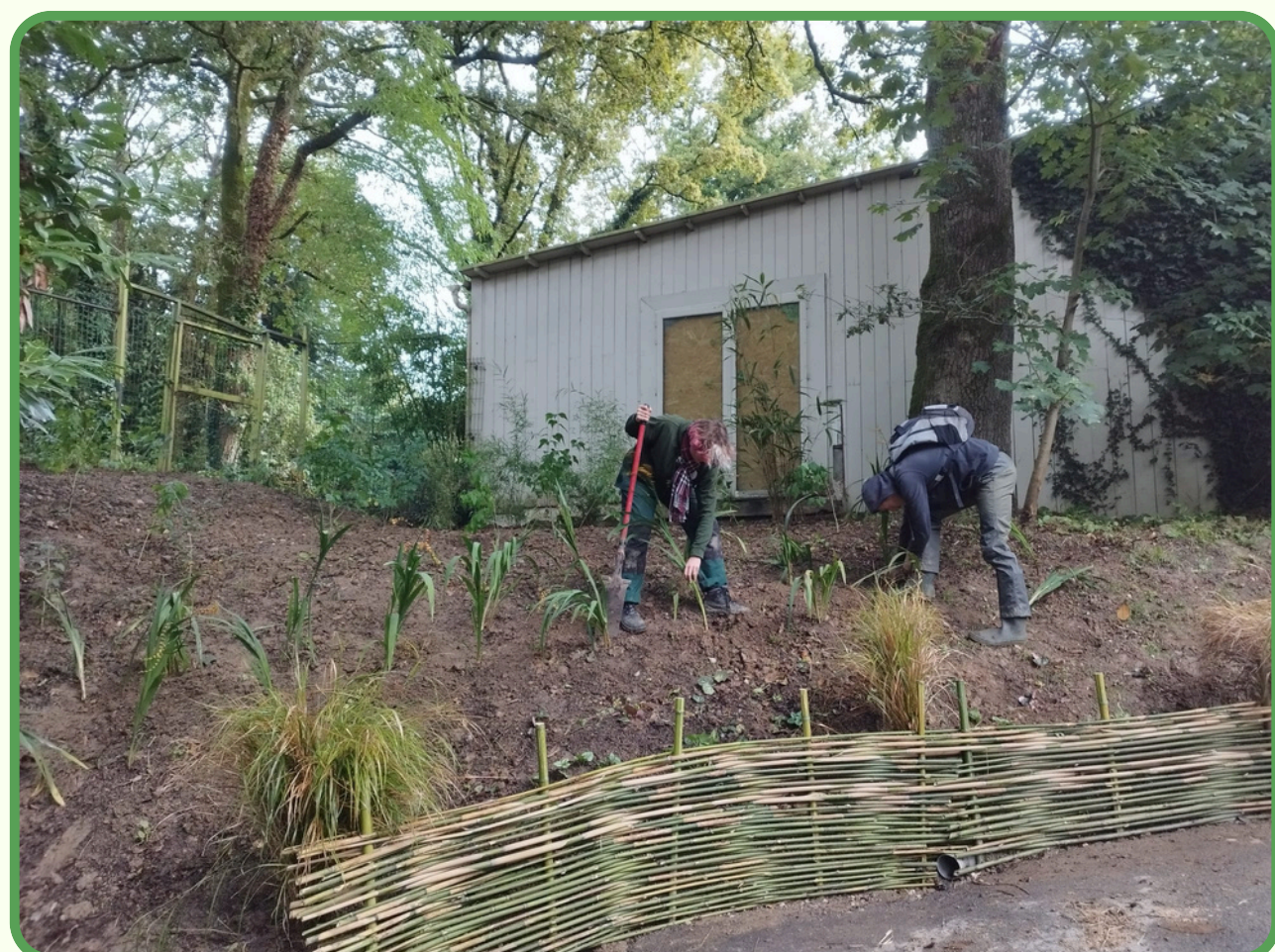
Chantier réalisé de A à Z avec un camarade

Je suis revenu dans cette structure en octobre pour réaliser un chantier de plantation sur lequel mon maître de stage me laissait carte blanche. Un ami de ma classe est venu lors de cette semaine