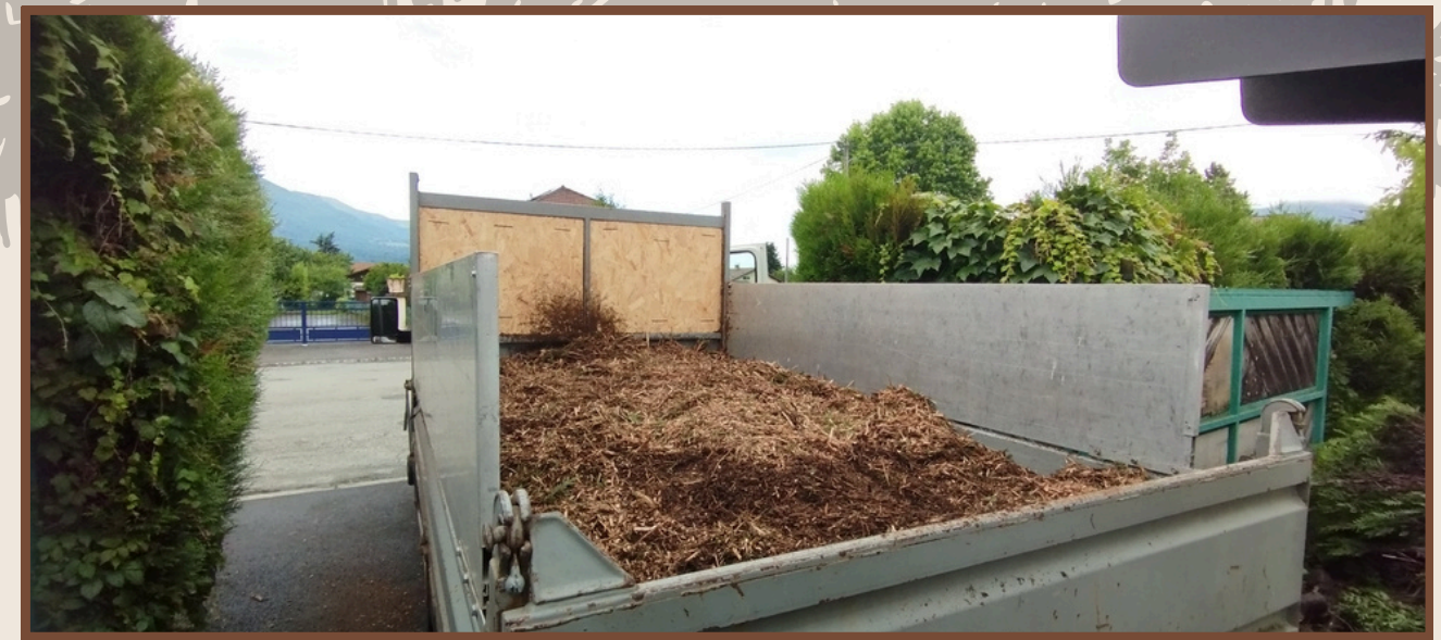
Broyeur Location 444€/J